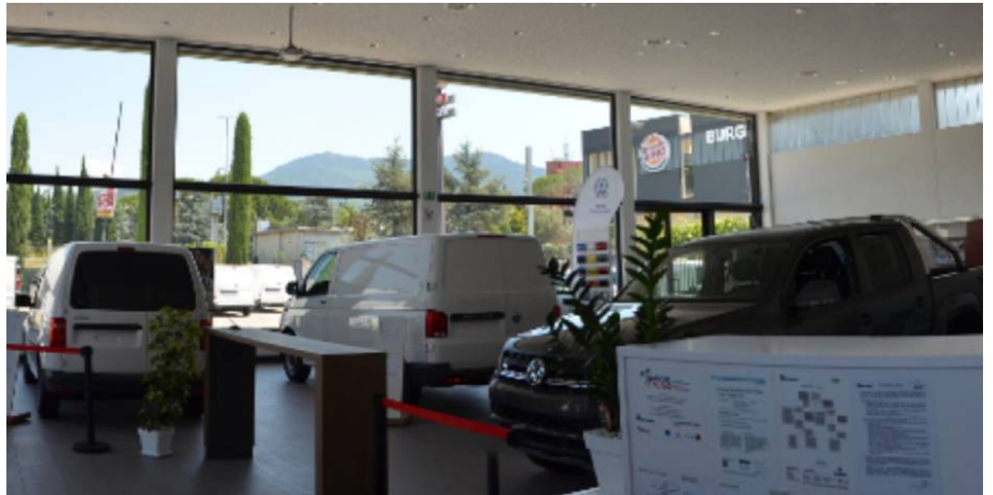
L'azienda Toscandia ha una delle sue sedi a Calenzano, davanti al casello autostradale. Un punto strategico per chi trasporta merci con veicoli venduti da questa solida realtà

Ma, come dicevamo, è l'aspetto legato alla mobilità ecologica che ha denotato gli ultimi anni di questa azienda: nel 2019 è nato, con il patrocinio del Comune di Firenze, il servizio di noleggio E-Van sharing rivolto ad artigiani, professionisti o privati che devono entrare nella Ztl di Firenze per un lavoro o per trasportare qualcosa di ingombrante. Grazie alla messa a disposizione del veicolo commerciale Nissan